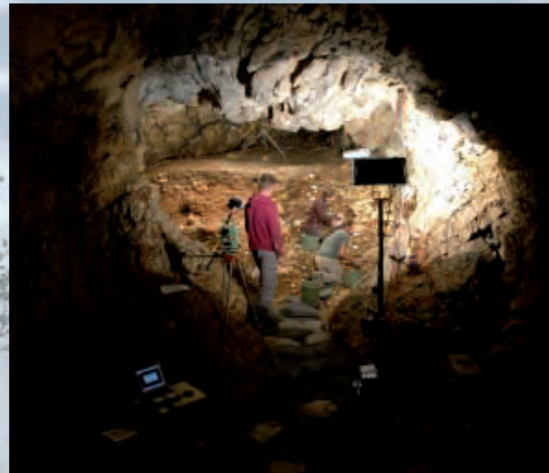
Die „Kammer des Löwenmenschen“ während der Ausgrabungen 2012.

Die „Höhlen der ältesten Eiszeitkunst“ genießen als außergewöhnliche Kulturdenkmale einen besonderen Schutz nach dem baden-württembergischen Denkmalschutzgesetz. Während die Höhlen selbst als „Kulturdenkmale von besonderer Bedeutung“ in das Denkmalbuch eingetragen sind, wurden die in den Tälern liegenden Flächen um die Höhlen großräumig als Grabungsschutzgebiete ausgewiesen. Dies garantiert den höchst möglichen denkmalrechtlichen Schutz, der einem angehenden Welterbe gerecht wird. Einer Beeinträchtigung des Kulturerbes wird vorgebeugt und die Erhaltung der einzigartigen Höhlenfundstellen mitsamt ihrer landschaftlichen Umgebung ist somit gesichert.