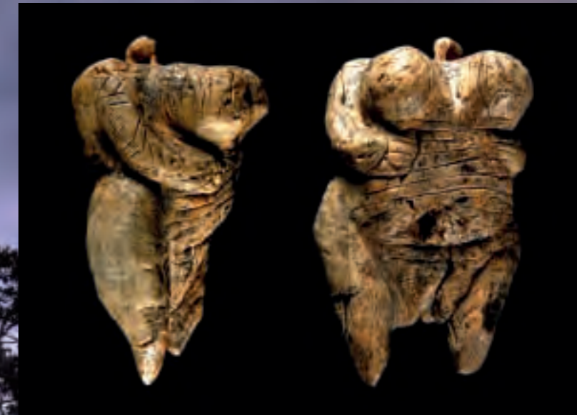
Die „Venus“ vom Hohle Fels im Achtal (Höhe 6 cm). Diese Elfenbeinfigur ist die älteste Frauendarstellung ihrer Art weltweit.