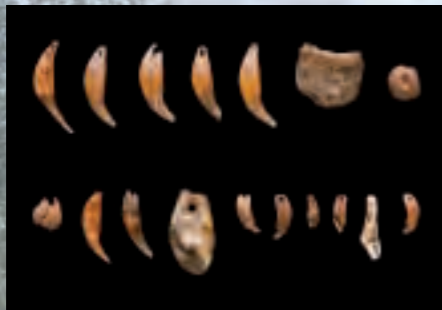
Schmuckobjekte, Hohlenstein Stadel-Höhle.