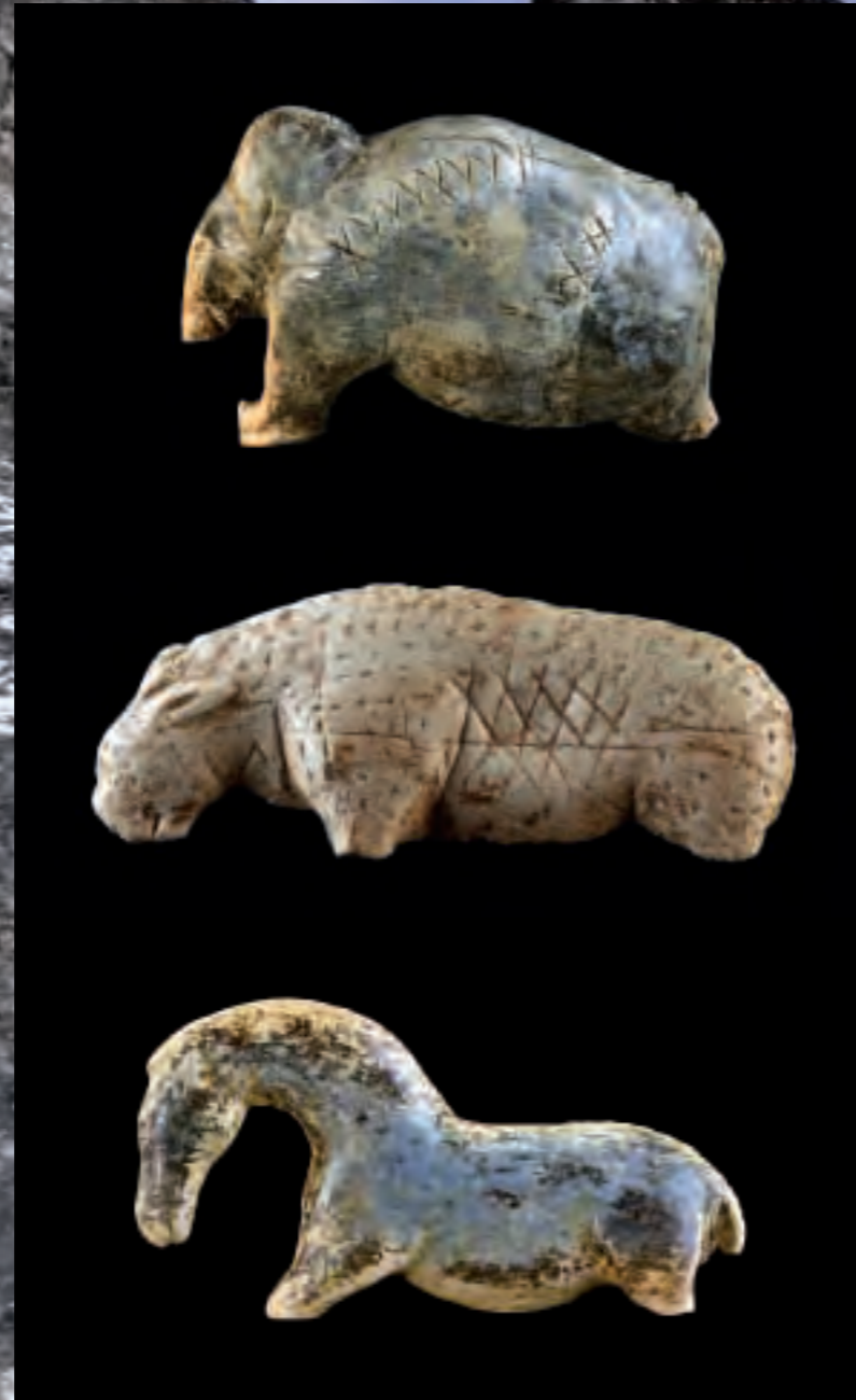
Elfenbeinfiguren aus dem Vogelherd im Lonetal: oben ein Mammut (Länge 5 cm), mittig ein Löwe (Länge 8,8 cm), unten ein Pferd (Länge 4,8 cm).

Die meisten der bislang gefundenen Kunstobjekte bilden die größeren Tiere der eiszeitlichen Landschaft einer Steppentundra ab – Mammut, Wisent, Pferd, Höhlenlöwe oder