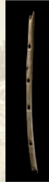
Flöte aus dem Knochen eines Gänsegeiers aus dem Hohle Fels im Achtal (Länge 11 cm).

Kunst- und Schmuckobjekte des Aurignacien stammen aus sechs Höhlenfundstellen im Lone- und Achtal auf der Schwäbischen Alb, in der Umgebung von Ulm gelegen. Hier befinden sich die Fundstellen Geissenklösterle, Hohle Fels und Sirgenstein im Achtal sowie Vogelherdhöhle, Hohlenstein Stadel-Höhle und Bocksteinhöhle mit dem Bocksteintörl im Lonetal. Lone- und Achtal stellen außergewöhnliche Fundlandschaften eiszeitlicher Jäger und Sammler mit einer singulären Konzentration von Fundplätzen dar. Die Region war nachweislich ein zentrales Siedlungsareal der frühesten modernen Menschen in Europa.