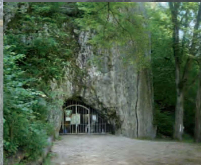
Eingangsbereich und Vorplatz des Hohle Fels im Achtal.