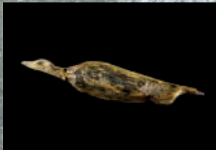
Elfenbeinfigur eines Wasservogels aus dem Hohle Fels im Achtal (Länge 4,7 cm).