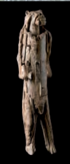
Die Elfenbeinfigur des „Löwenmenschen“ aus dem Hohlenstein Stadel im Lonetal (Höhe 31 cm).